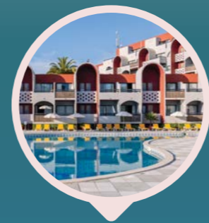
Muthu Oura Praia Hotel