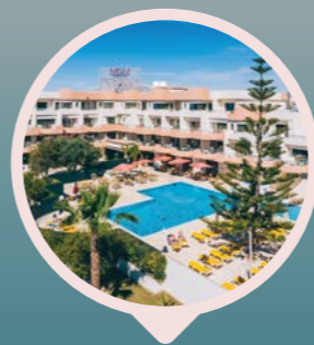
Muthu Forte da Oura