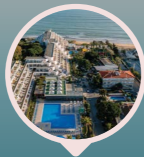
Muthu Clube Praia da Oura